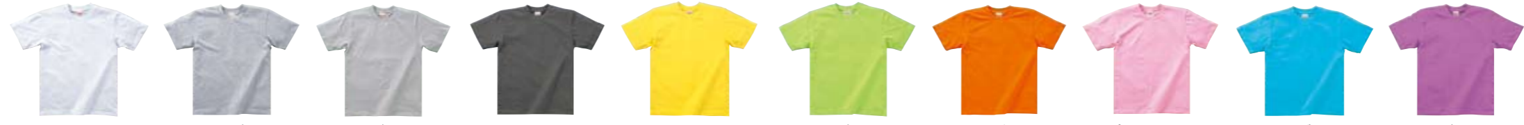
アッシュ: AS ミックス グレー: MG ライト グレー: L.GL チャコール: CH イエロー: YW この色には、100cm サイズもあります。 ライム グリーン: LM オレンジ: OE ピンク: PK この色には、100cm サイズもあります。 アクア ブルー: AQ この色には、100cm サイズもあります。 ラベンダー: LA この色には、100cm サイズもあります。