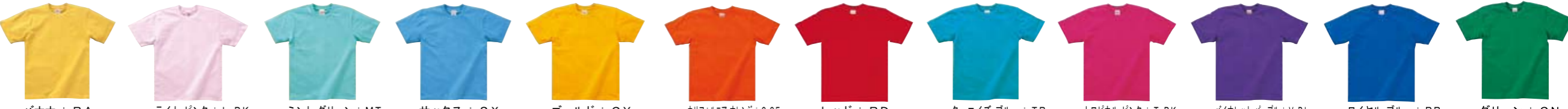
バナナ: BA ライト ピンク: L.PK ミント グリーン: MT サックス: SX ゴールド: GY カリフォルニア オレンジ: C.OE レッド: RD この色には、100cm サイズもあります。 ターコイズ ブルー: TB トロピカル ピンク: T.PK バイオレット パープル: V.PL ロイヤル ブルー: RB この色には、100cm サイズもあります。 グリーン: GN