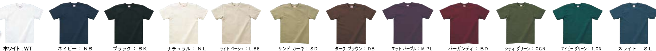
ホワイト: WT この色には、90cm, 100cm, XXXL サイズもあります。 ネイビー: NB この色には、100cm, XXXL サイズもあります。 ブラック: BK この色には、100cm, XXXL サイズもあります。 ナチュラル: NL ライトベージュ: L.BE サンド カーキ: SD ダーク ブラウン: DB マット パープル: M.PL パーガンディ: BD シティ グリーン: CGN アイビー グリーン: I.GN スレイト: SL